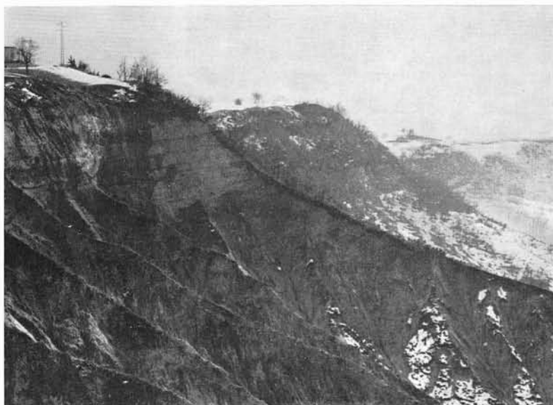
FIG. 3 - Interfluvio tra due sistemi calanchivi ricoperto da materiali siltoso-sabbiosi eluviali e colluviali e sede di sporadica vegetazione arborea. Alla sommità del versante si può osservare la ripa arenaceo-conglomeratica.

cene medio e allineati lungo i versanti destri dei fossi dell'Inferno e Squarcia (bacino del Tenna). Per la maggior parte di queste forme ricorrono i fattori strutturali e di esposizione ritenuti dagli Autori di importanza fondamentale nella morfogenesi calanchiva: esse sono infatti