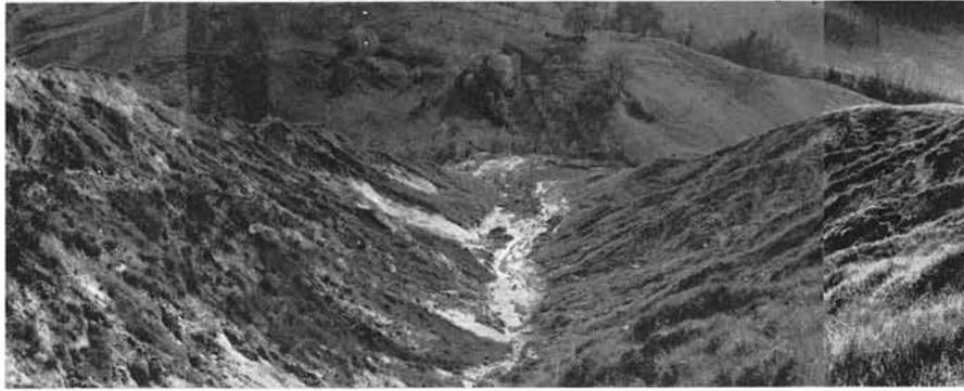
Fig. 4 - Colata plastico-fluida interessante i materiali di accumulo in una vallecchia calanchiva.

mente i processi morfogenetici sui due opposti versanti dei fossi dell'Inferno e Squarcia.