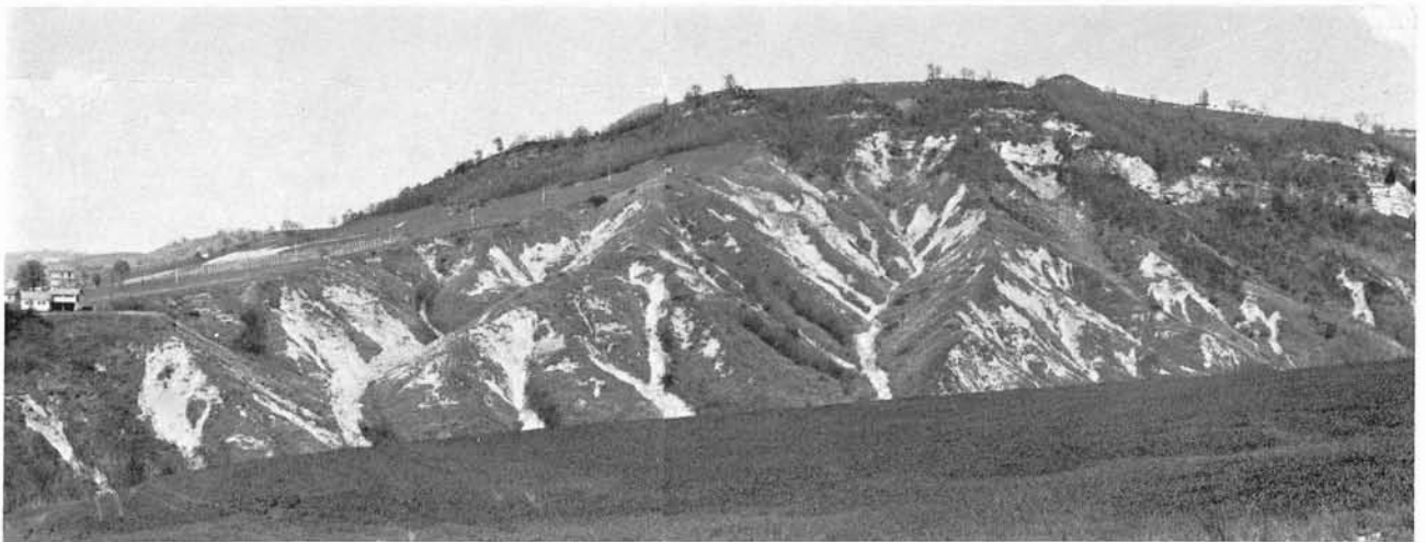
FIG. 1 - Il versante destro del Fosso Squarcia interessato da forme calanchive. In alto si osserva la ripa arenaceo-conglomeratica, al centro la superficie di erosione dolcemente inclinata e ricoperta in parte da detriti, a sinistra un terrazzo alluvionale posto a circa 50 m sul fondovalle attuale.

L'area rappresentata nella tav. 1, compresa tra gli abitati di Monte San Martino e Santa Vittoria in Matenano, presenta numerosi calanchi scolpiti nelle argille del Plio-