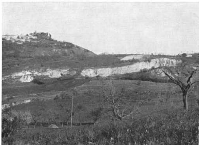
FIG. 2 - Versante sinistro del Fosso Squarcia interessato da movimenti franosi. La scarpata di frana, pressoché rettilinea, è impostata lungo una frattura.

cene medio e allineati lungo i versanti destri dei fossi dell'Inferno e Squarcia (bacino del Tenna). Per la maggior parte di queste forme ricorrono i fattori strutturali e di esposizione ritenuti dagli Autori di importanza fondamentale nella morfogenesi calanchiva: esse sono infatti